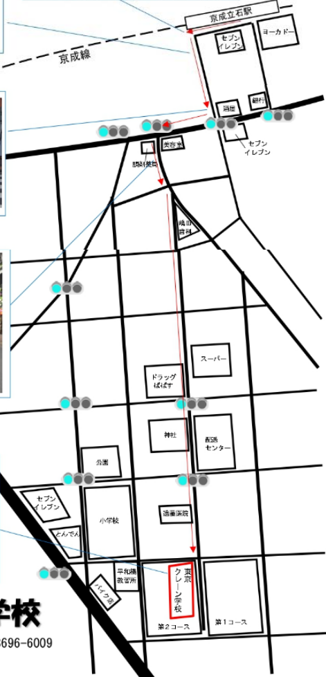
主要駅からの路線図