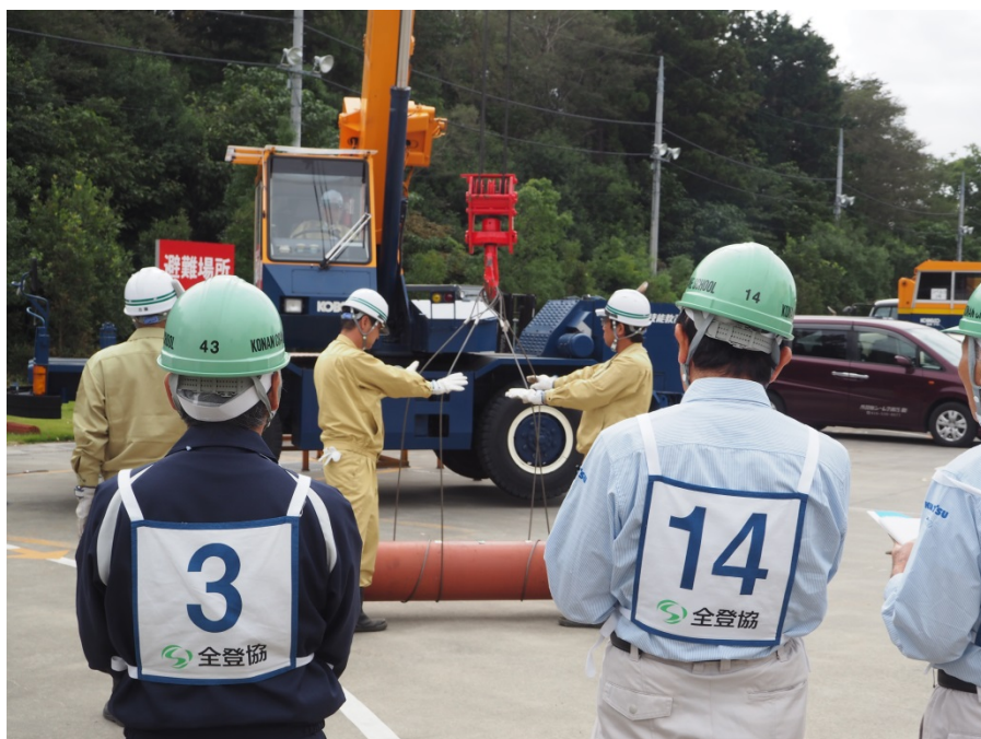
←あだ巻の基本を習得