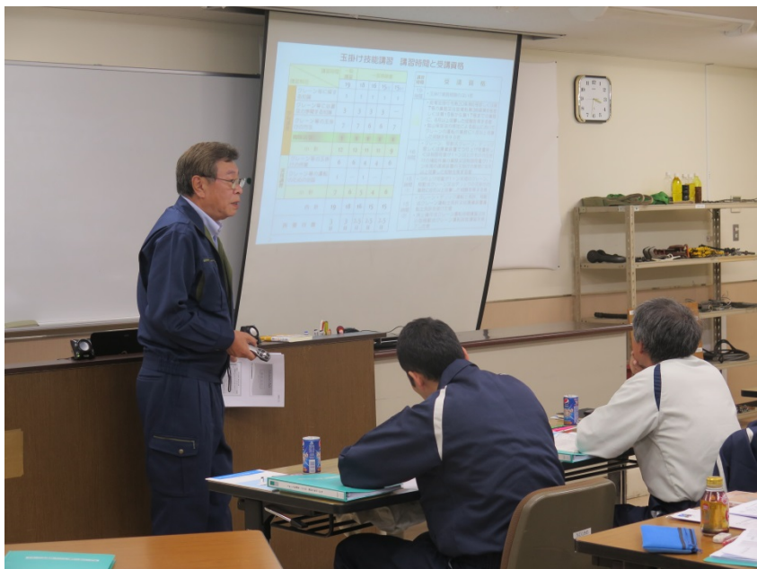
←森下アドバイザーによる「関係法令」