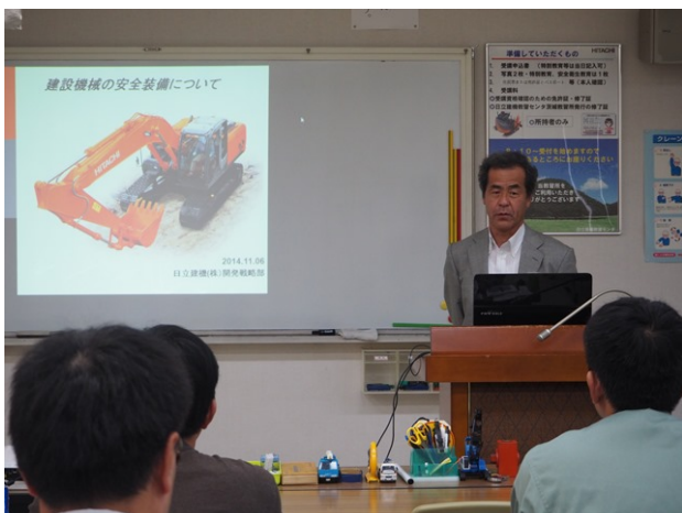
「インストラクション技術の向上」での参加者による 模擬講義→