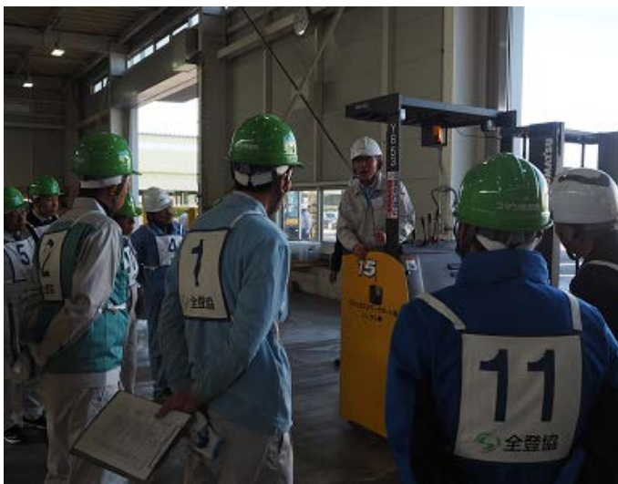
←リーチフォークの作業開始前点検方法 の習得