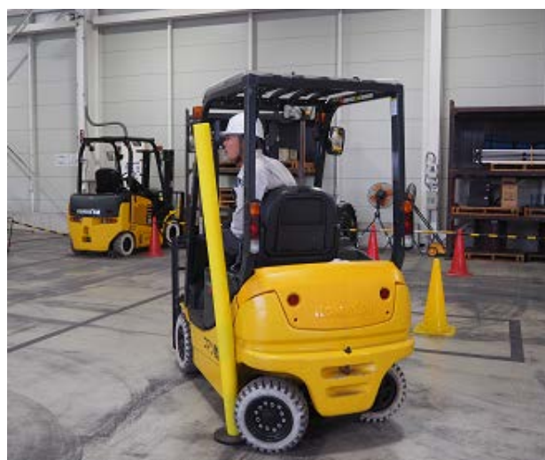
後輪での巻き込まれの危険体感→