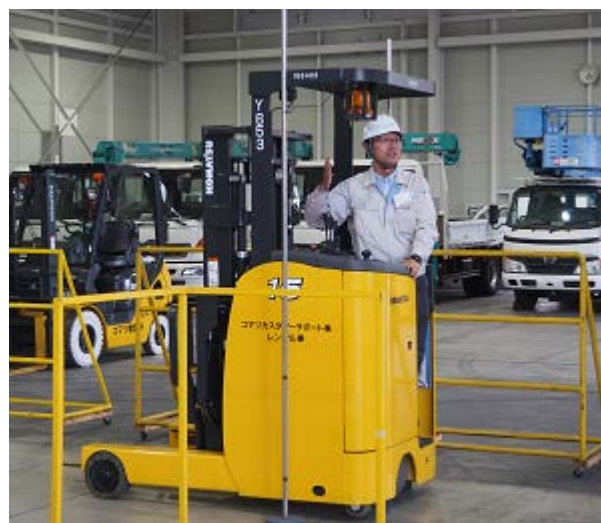
リーチフォークでのバック時での危険体感→