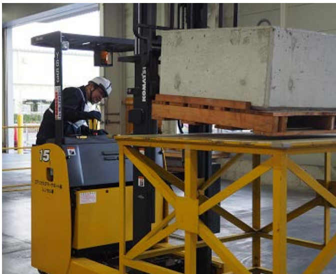
←リーチフォークの運転操作の体験