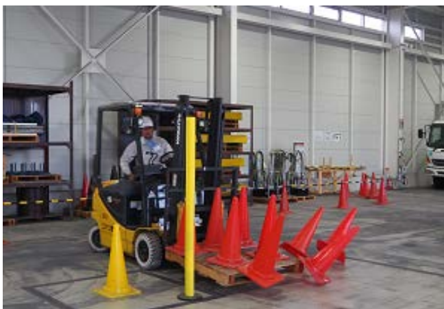
←急旋回時での荷崩れ作の危険体感