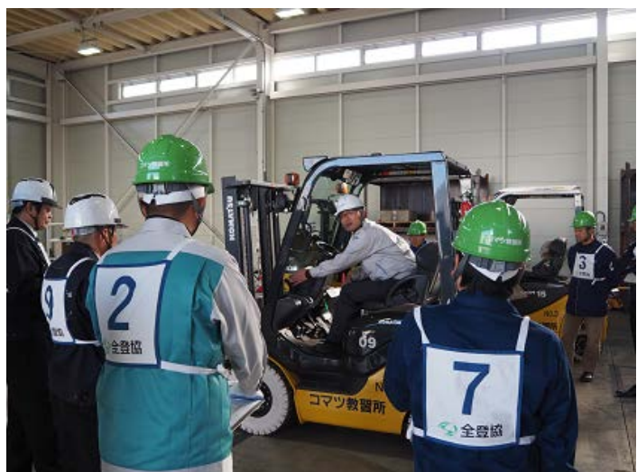
←バッテリー・カウンターフォークの運転操作 体験