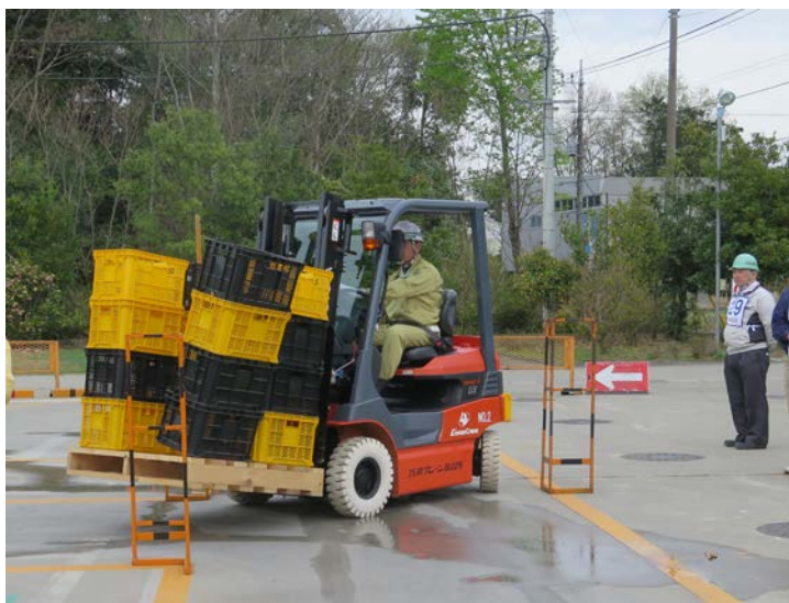
←急ハンドルでの荷崩れ体験