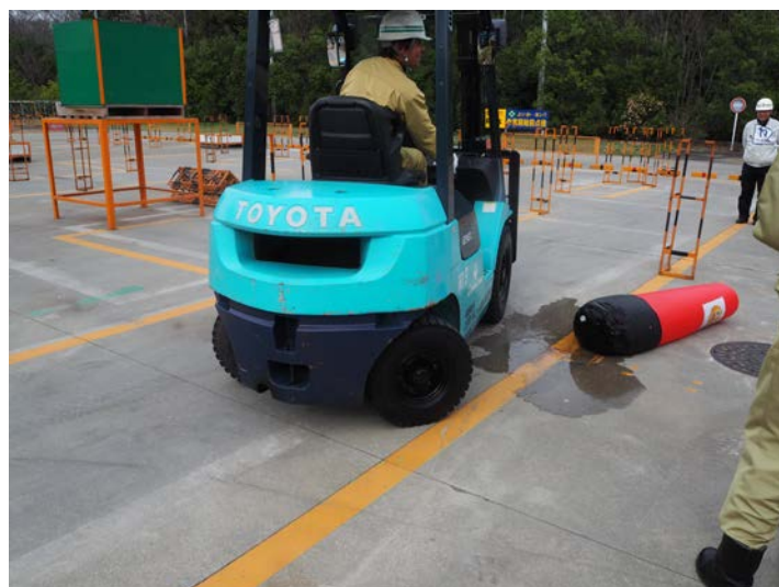
作業員等の侵入による接触の→ 危険体感