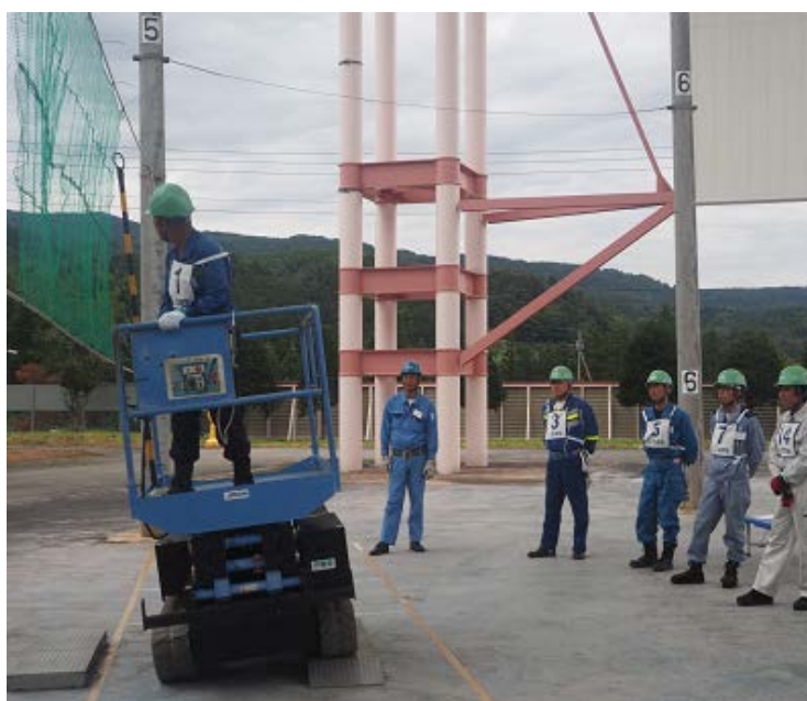
段差による壁方向への傾きを体験→