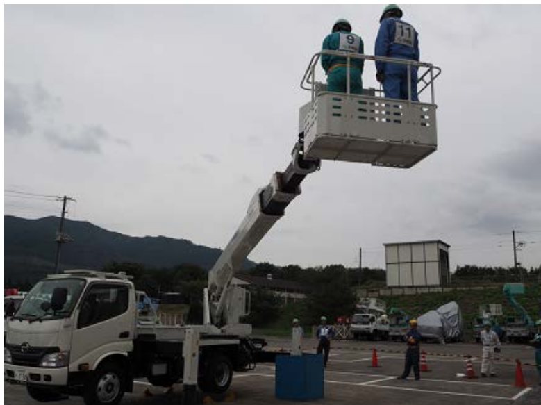
「地盤養生不良における危険の確認」