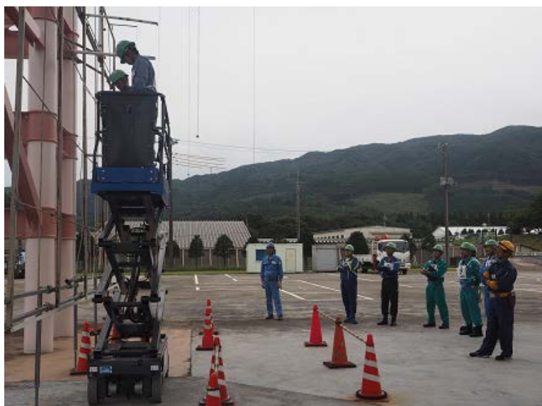
←「死角の確認」 使用機械はバッテリー駆動シザース 型高所作業車