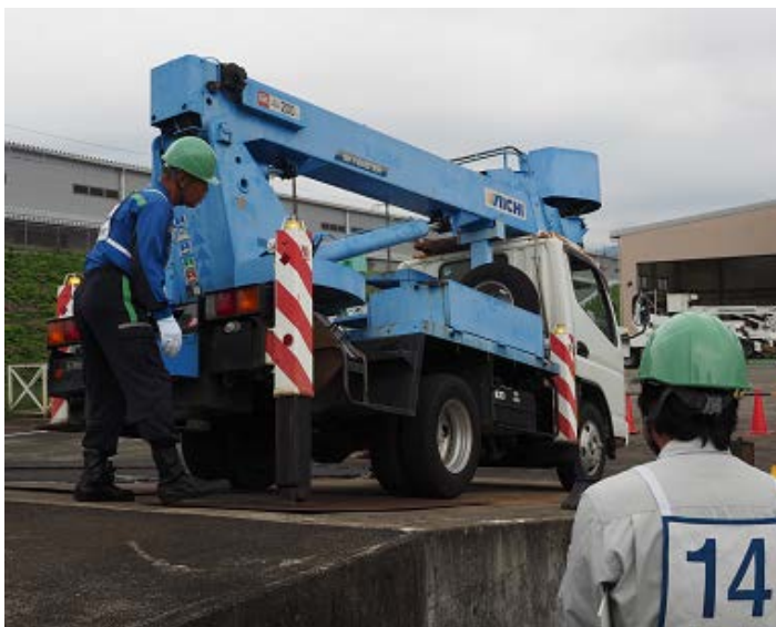
傾斜地における危険の確認→ 後部アウトリガージャッキ伸ばしによる逸走