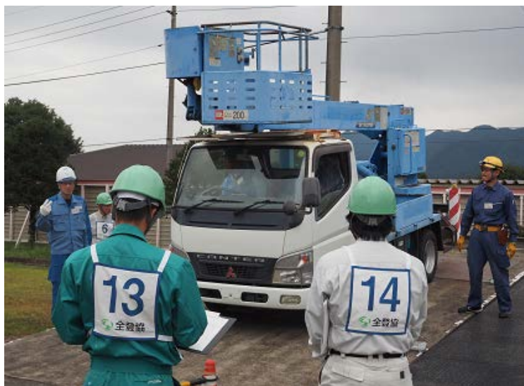
←勾配に対してアウトリガー 張り出しの手順の確認