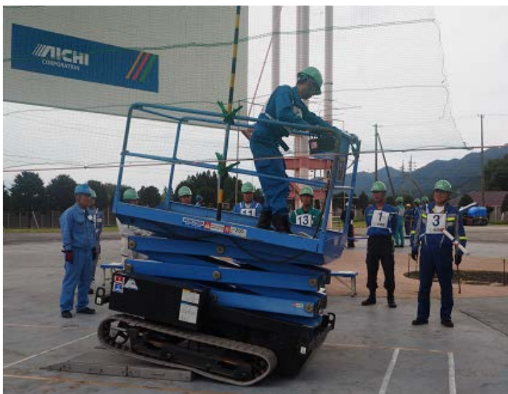
「段差走行」 ←作業床を 30cm 上昇させ段差 9cm を乗り越える