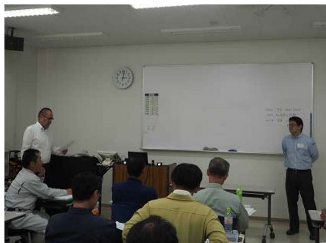
受講者同士による 「受講者の講義演技」に対する講評→