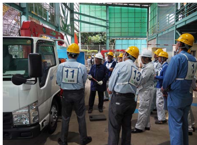
基本操作のポイント ・教え方を学ぶ →