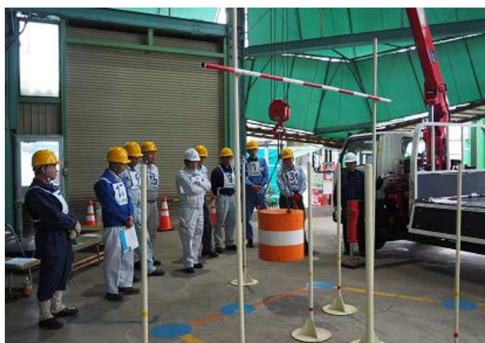
「定められたコースのまわり方」 の教え方について学ぶ →