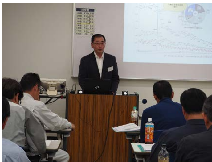
←野澤調査役による 「関係法令・災害事例」