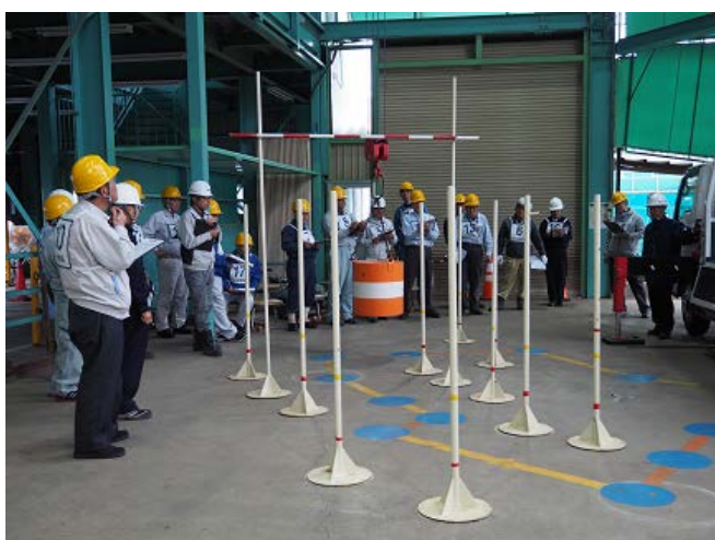
←全員で 講師の「わざとミスした実技」 を採点