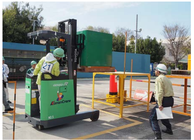
リーチフォークの運転操作体験→