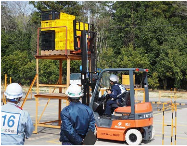
←バッテリー・カウンターフォーク の運転操作体験