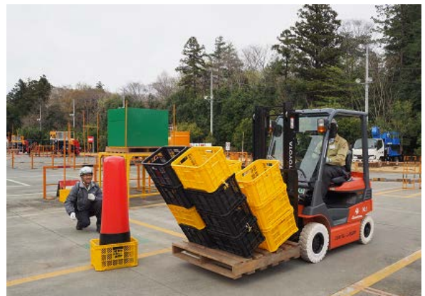
急ブレーキ時での荷崩れの危険体感→