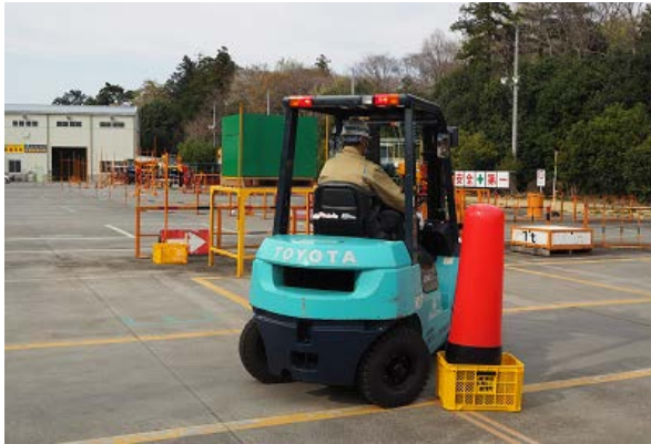
←後輪での巻き込まれの危機体感